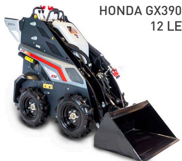
HONDA GX390 12 LE

A forradalmi Z-sorozatunk legújabb bemutatott gépei: a SHERPA Z30, Z40 és Z50. Erős benzin- vagy dízelmotorral hajtott, ezért abszolút erőgép. A sorozat többi tagjához hasonlóan ezek a gépek is ergonómiailag optimalizáltak, biztosítva, hogy a vezető a lehető legergonomikusabb pozícióban álljon. A SHERPA Z-sorozat az erőteljes kényelem csúcsa, és kétségtelenül a következő lépés az okos munka terén.