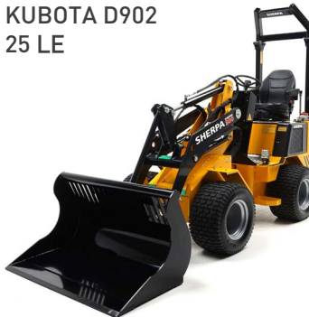
KUBOTA D902 25 LE

Minimális, mindössze 76 centiméteres munkaszélességgel a legkisebb csuklós rakodó a piacon! A SHERPA 150 az ideális gép, ha gyakran dolgozik szűk helyeken, mert ezt a kis gépet minden szűk sarkon és folyosón gond nélkül át tudja manőverezni. Az opcionális széles gumibroncsok stabilitást és alacsony talajnyomást biztosítanak, ami csökkenti a felületi barázdákat. Ez a gép tökéletes minden kertépítő számára, és erőteljes támasz a zöldiparban!