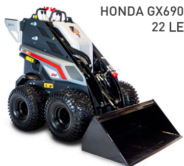
HONDA GX690 22 LE

A SHERPA Z30 mindössze 76 centiméter széles, ezért nem okozhat gondot a gép manőverezése szűk átjárókon, például lifteken, ajtókon és kertkapukon keresztül. Ez teszi a Z30-at ideális eszközzé minden kertépítő, mezőgazdasági munkás és a zöldiparban dolgozó szakember számára!