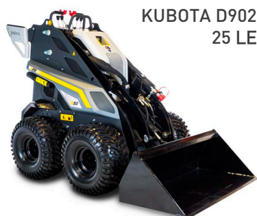
KUBOTA D902 25 LE

Szélesebb és még erősebb, mint kistestvére, a Z30. A SHERPA Z40 114 centiméter széles és elég erős ahhoz, hogy minden nehéz feladatot elvégezzon Ön helyett.