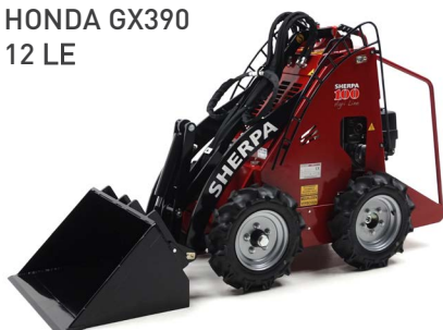
HONDA GX390 12 LE

Kis méretben, nagy megközelítésben. A SHERPA 100 kompakt, de nagy teljesítményű. Ezenkívül kis mérete számos gyakorlati előnnyel jár. A SHERPA 100 könnyedén szállítható egy kisbuszban, és nem okoz gondot számára a szűk helyeken, például ajtókon és lifteken való átjutás. Ez a gép tehát az okos munkavégzés kiváló példája! A SHERPA 100 76 vagy 114 centiméter szélességben készül, és benzin- vagy dízelmotorral kapható.