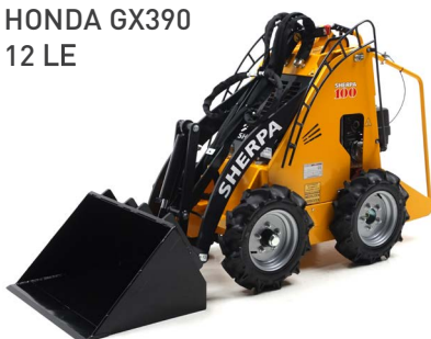
HONDA GX390 12 LE

Szüksége van egy plusz pár kézre az istállóban vagy a gazdaságban végzett munka során? A 76 centiméter széles SHERPA 100 Agri-Line könnyen manőverezhető az istállóban, hogy ott nyújtson támogatást, ahol arra szükség van. Például az istállók trágyázásával, valamint szalma, széna és takarmány szállításával.