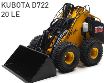
KUBOTA D722 20 LE

A SHERPA 100 Petrol minden kihívásnak megfelel! Erős és megbízható HONDA motorjával ez a gép elvégzi Ön helyett a nehéz munkákat. A SHERPA 100 Petrol az utak kátyúzásától a tuskók elhúzásáig bármilyen feladatban szívesen segít.