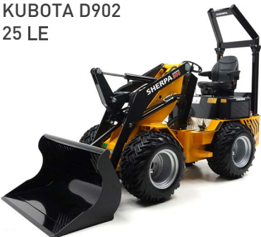
KUBOTA D902 25 LE

A SHERPA 200 rendelkezik minden olyan erővel, amely bármilyen feladat sikeres elvégzéséhez szükséges! Ezenkívül ez a csuklós rakodógép a tartozékok széles választékával felszerelhető. Ezért a SHERPA 200 nagyon népszerű az útépítéssel foglalkozó szakemberek és a nagyszabású projektekkel foglalkozó kertépítők körében.