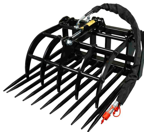
CSAPOS KANÁL BILINGCSEL