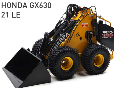
HONDA GX630 21 LE

Nehéz munka szűk helyeken? A SHERPA 100 Small minden feladatot pontosan és hatékonyan végez el az Ön számára. Használhatja a talaj mozgatására és kitermelésére, de anyagok szállítására és eltávolítására is. Az ideális gép az építőipari és bontási szakemberek számára!