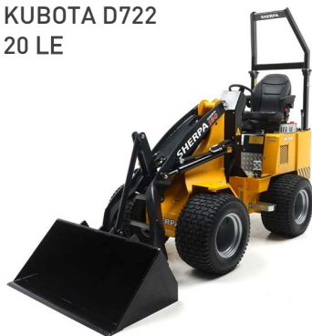
KUBOTA D722 20 LE

Bár a csúszókormányos minirakodók már mérföldköveket állítottak fel, amikor az okos munkavégzésről van szó, a csuklós rakodók még egy lépéssel tovább mennek! Nagyobb sebesség, teljesítmény és emelő kapacitás, nem kevesebb, mint két külső funkcióval. A csuklós rakodók a vezető számára ülőfelülettel is rendelkeznek, ami nagyobb vezetési kényelmet biztosít. Tekintse meg kibővített kínálatunkat, és találja meg új csapatársát!